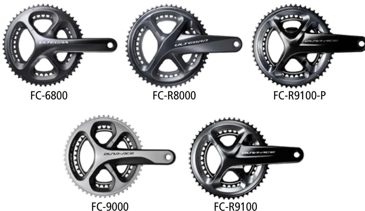
Obrázek 1. Obrázek klikových sad, které mohou být předmětem prohlídky.

Upozorňujeme, že tento dobrovolný program prohlídek se netýká žádných jiných klikových sad Shimano.